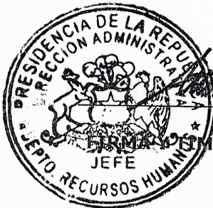
FIRMA DEL DECLARANTE